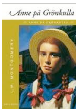
Anne på Grönkulla av Lucy Maud Montgomery (fortsättning finns)