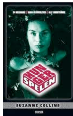
Hungerspelen av Suzanne Collins (fortsättning finns)