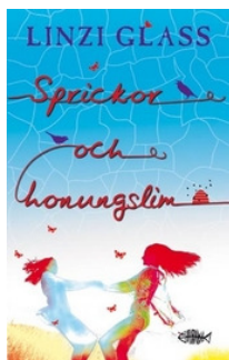
Sprickor och honungslim av Linzi Glass