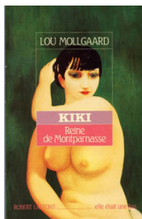
Kiki – drottning av Montparnasse av Lou Mollgaard