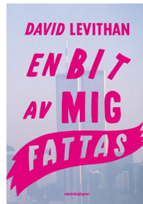
En bit av mig fattas av David Levithan